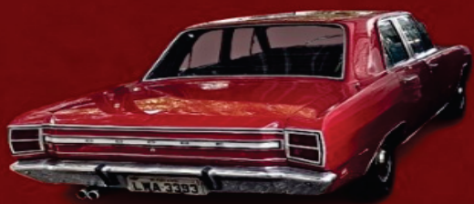
DODGE DART SEDAN LUXO