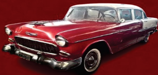
CHEVROLET BEL AIR