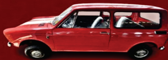
HONDA NR 360