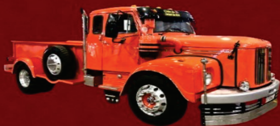
SCANIA 110 (PICK-UP MOSTER)