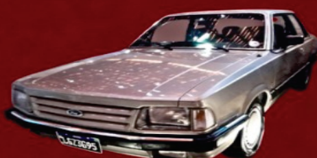
FORD DEL REY GHIA